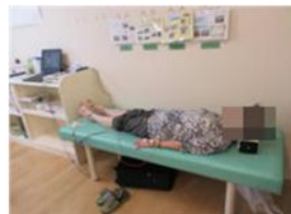
『サロン』での体組成・物忘れ測定の様子