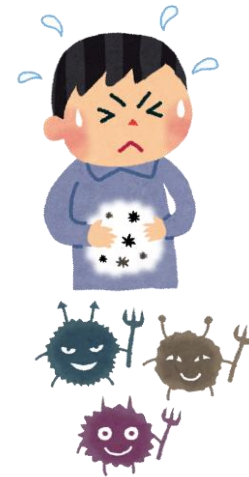
■ 食中毒予防の3原則